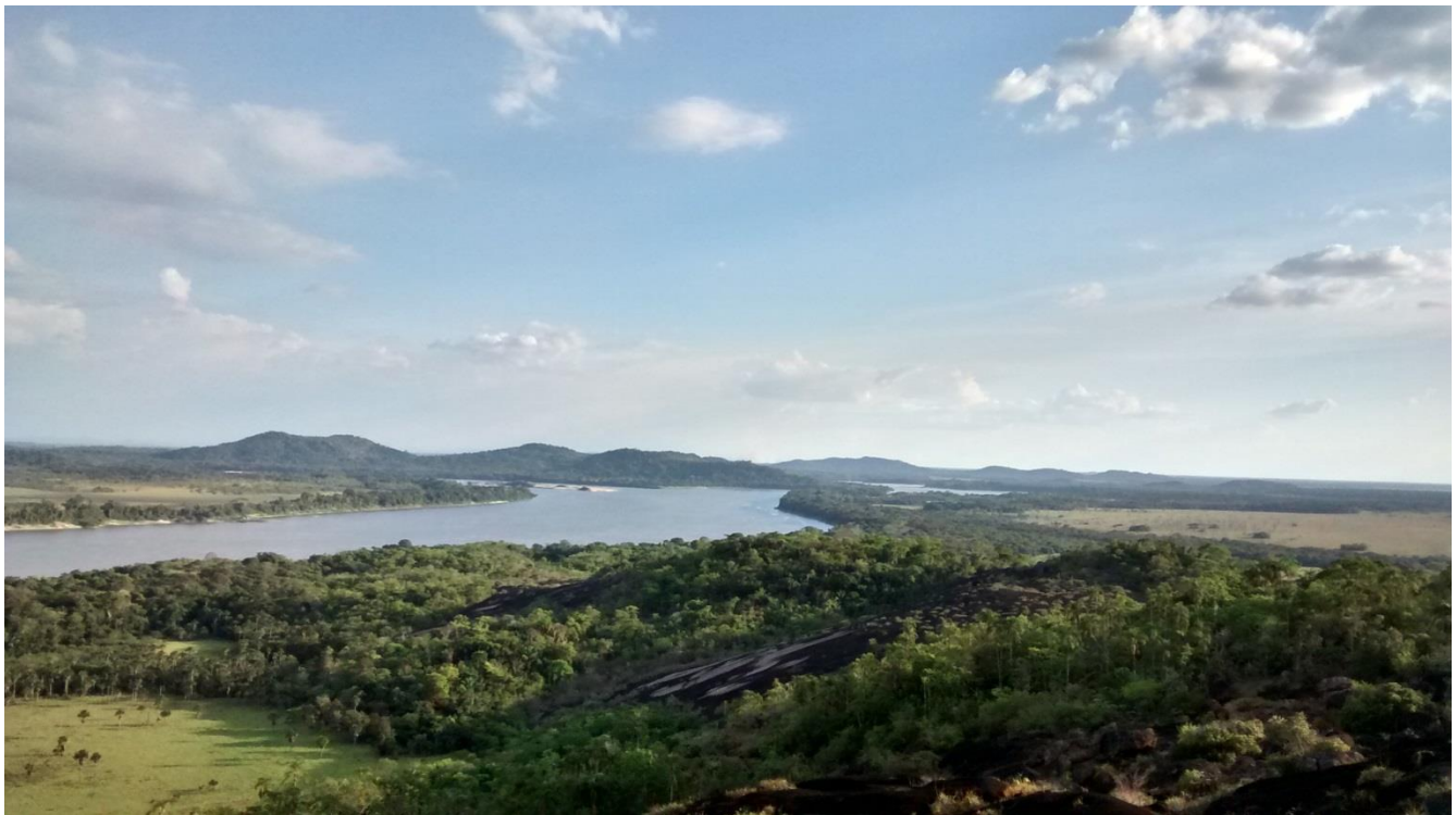
Río Orinoco desde Cerro Thomas, PNN El Tuparro.

Parte II: Atributos e Indicadores Asociados a la Presión sobre los Valores Objeto de Conservación